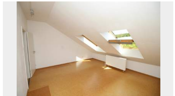
Schlafzimmer im Studio