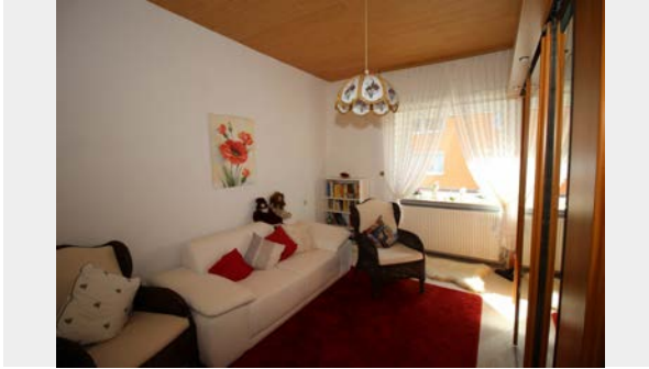
Kinderzimmer 1. OG