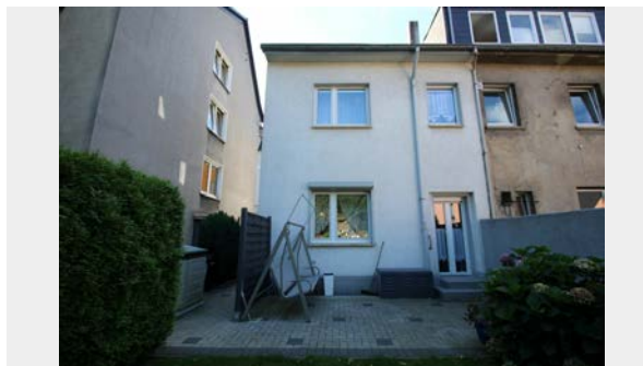
Rückansicht mit Terrasse