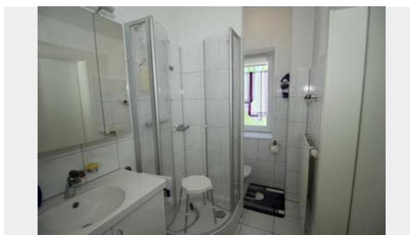
Bad 1. OG