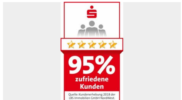
Überzeugen Sie sich selbst!