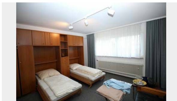
Gästezimmer im Untergeschoss