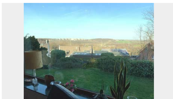
Ausblick aus dem Wohnzimmer